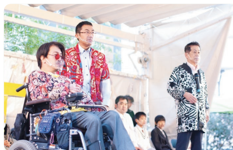
車いすユーザーと演じた新喜劇のひとこま。 イベント「ミーツ・ザ・福祉」にて

全国の社協の皆さんも、真面目に取り組むことはもう十分できていると思いますので、これからは「おもしろがる視点」をもっといただくとよいのではないのでしょうか。また、社協のなかだけで考えているといろいろと煮詰まってくることもあると思いますので、どんどん地域の団体や関係者に相談するとよいと思います。そうすると、私と一緒に漫才をした当事者のように、やる気のある人に思いつけないかたちで活躍してもらえ場所が、たくさん見つかるのではないかと思います。