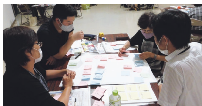
連絡会のグループワーク。考えられた文言をスゴロク状に配置する

ア出しを繰り返すのみで、実際の行動までには至っていませんでした。そこでこれまでの取り組みを振り返り、成果が見える新たなグループワークの方法として、スゴロクが生み出されたのです。