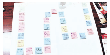
グループワークの結果、ふくしスゴロクの原型ができあがった