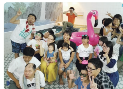
銭湯を貸し切って皆で入浴。 ナイトプールの雰囲気を出した