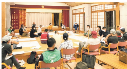
団体連絡会議3回目の様子。 地図を広げ、各団体の活動場所等の共有

平成31年に、八代青年会議所と氷川町社協、八代市社協とで「災害発生時における被災地支援等に関する協力協定」を締結しており、3者で年1回の意見交換や災害VC設置訓練をしていました。今回は発災の前月に意見交