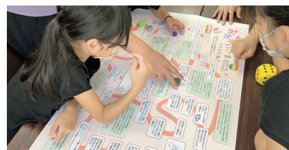
スゴロク拡大版デビュー！（子ども食堂にて）